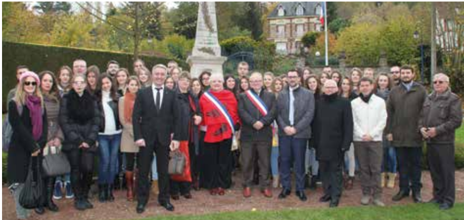
Jour du souvenir le 11 novembre 2016 en présence de la Délégation serbe et de 35 lycéens de la Ville de Prokuplje

Un spectacle orchestré et réalisé par l'équipe de l'Action Culturelle d'Épône qui traduit la mémoire des hommes et les récits de femmes 1914-1918. Assemblée comme une photo déchirée que l'on reconstruit, cette création poignante inspirée de faits réels, est servie et renforcée par un texte fort et sobre, une musique inédite et puissante, des chorégraphies et tableaux dansés uniques, des créations picturales et des images d'archives recréées. Réservation auprès du CAC : 01 30 95 60 29 / centre.culturel@epone.fr