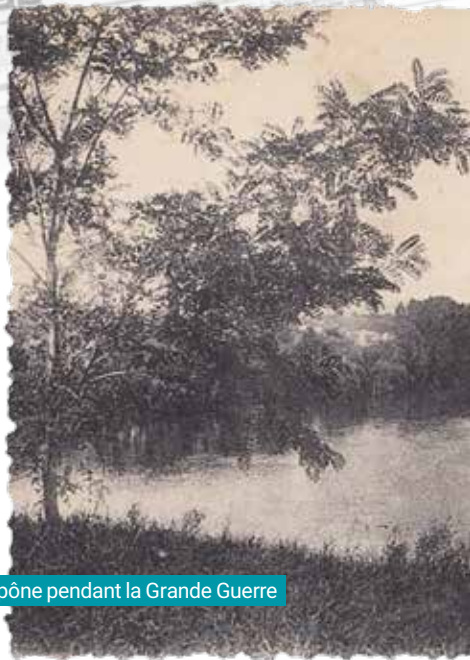
Vue d'Épône pendant la Grande Guerre