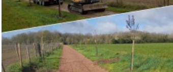
Chemin aux étoiles Chemin de fort-à-faire 78680 Épône