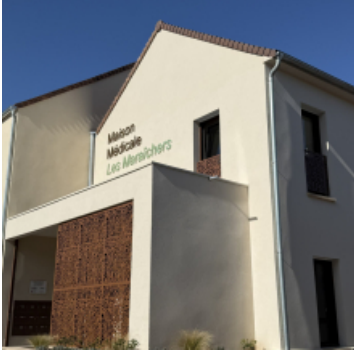
Maison médicale Les Maraichers place de la Libération 78680 Epône