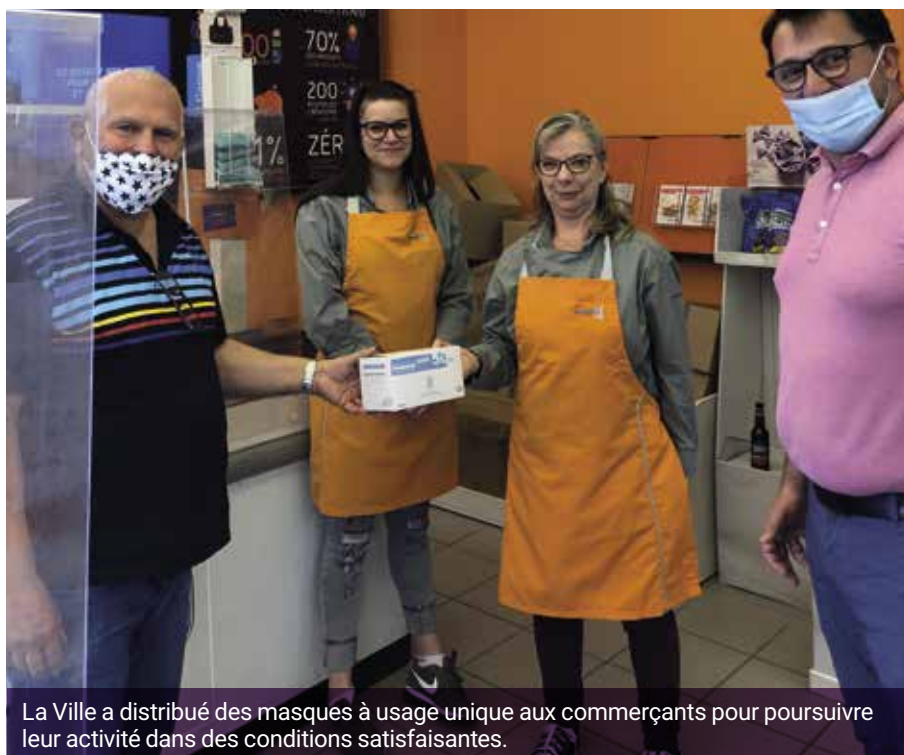
La Ville a distribué des masques à usage unique aux commerçants pour poursuivre leur activité dans des conditions satisfaisantes.

La Ville se dote de masques et de protections, pour la population et tous les professionnels en première ligne face à cette épidémie. Les masques destinés aux habitants seront distribués dans les boîtes aux lettres.