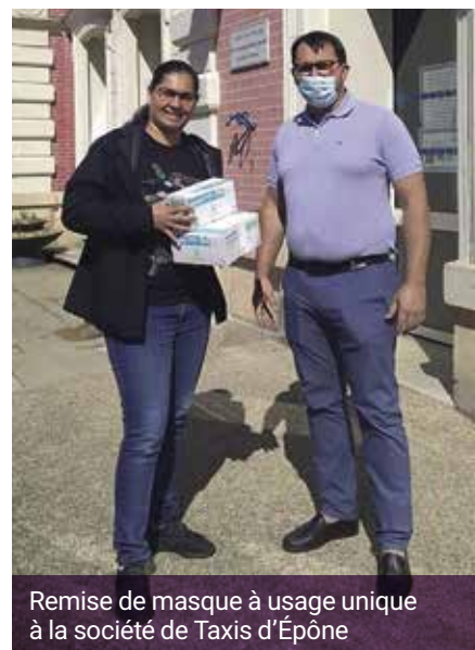
Remise de masque à usage unique à la société de Taxis d'Épône

Gels hydroalcooliques et gants sont fournis par la Ville pour l'ensemble des enseignants, du personnel en contact avec du public et des personnes vulnérables. Du savon liquide est mis à disposition dans les différents équipements publics par la société Le Petit Olivier, basée à Épône.