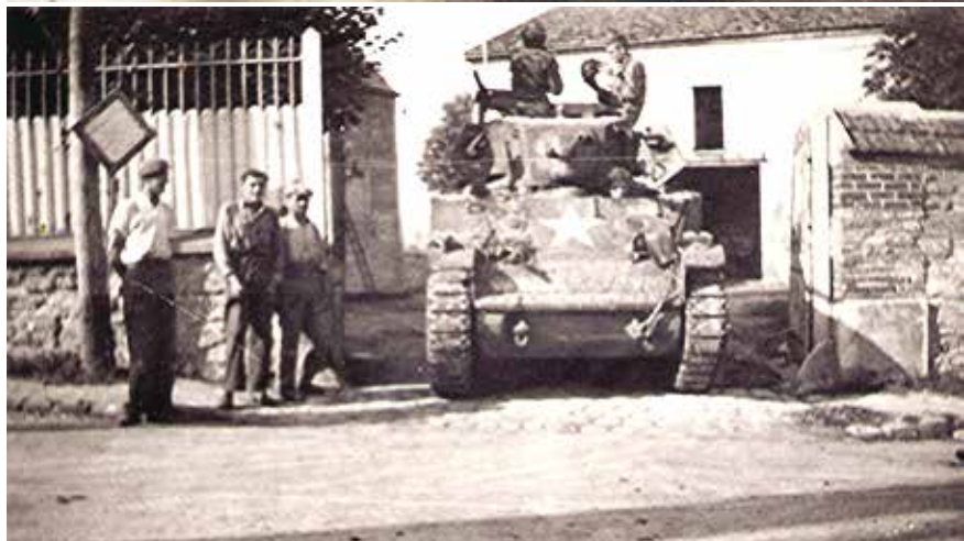
La Libération d'Épône par la reconnaissance et les chars de la 79 e division d'infanterie américaine