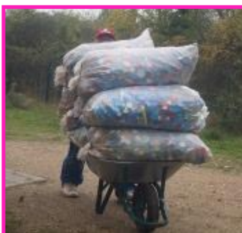
Solidarité toujours présente aujourd'hui et confort amélioré pour les bénévoles avec brouettes et diables.