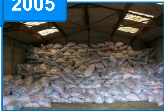
Le hangar à Chatou....