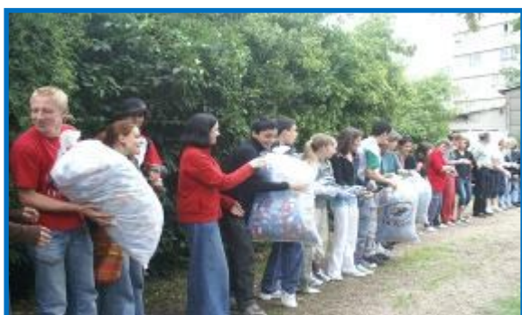
Première étape du chargement: déstocker les sacs grâce à la solidarité.