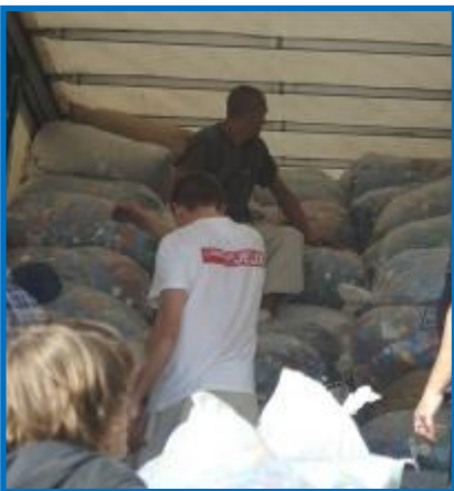
Les sacs sont empilés directement dans le camion.