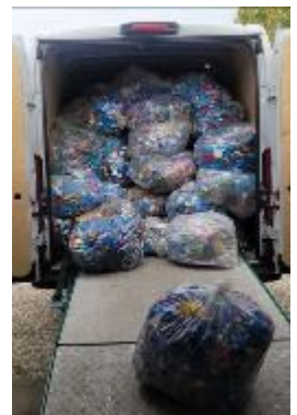
Camionnette et camion pleins !!!