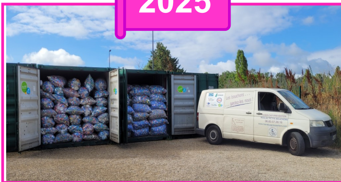
Nos quatre containers à Croissy ....