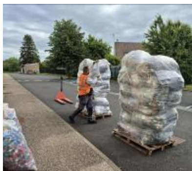
Enlèvement des sacs à Fontenay-Trésigny

Grâce à D Groupe nous allons pouvoir élargir nos collectes en province. Un immense merci à eux pour ce partenariat.