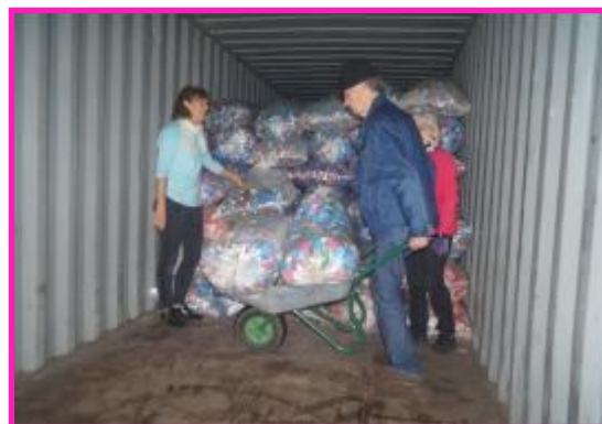
...au stockage en containers à Croissy par rangées de 5 sacs sur 7 de hauteur, jusqu'à 16 rangées soit 560 sacs par container. Ainsi le comptage du stock est possible à tout moment grâce aux repères sur les parois de chaque container.