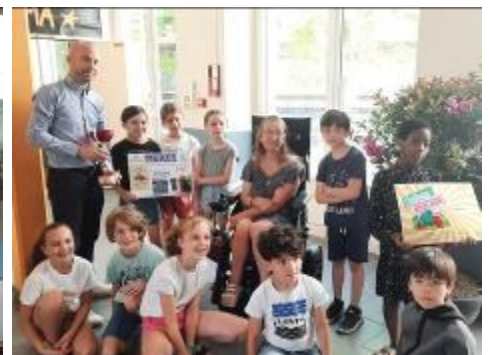
Ecole Lazard Carnot