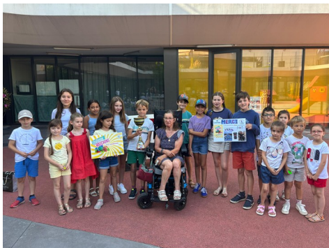
Ecole Georges Pompidou