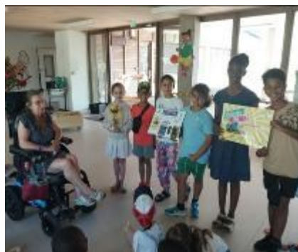
Ecole Marcel Pagnol