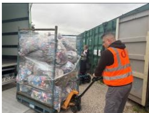
Livraison à Croissy