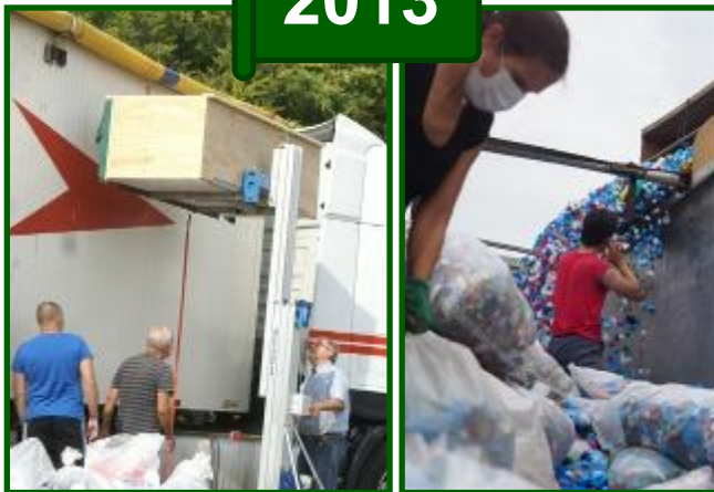
2013, une première machine vient aider le chargement des bouchons en vrac. Les sacs sont maintenant recyclés.