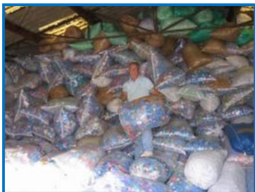
De l'empilage manuel...et acrobatique des sacs dans le hangar à Chatou....